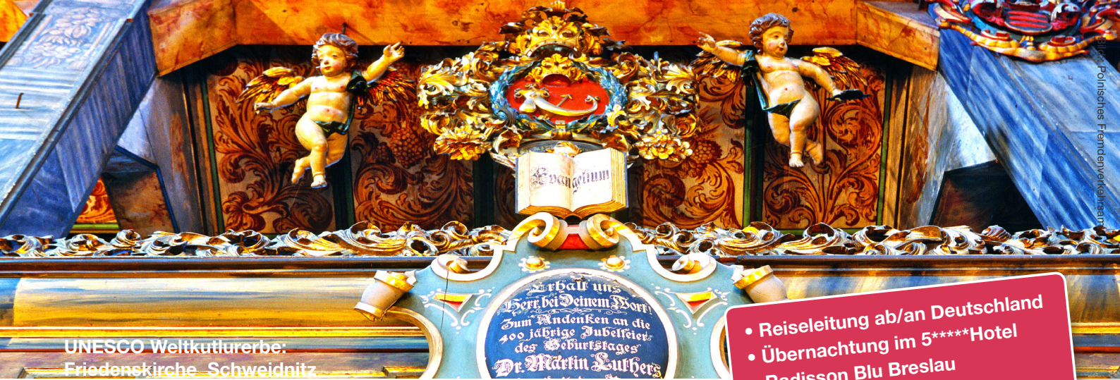
UNESCO Weltkulturerbe: Friedenskirche Schweidnitz