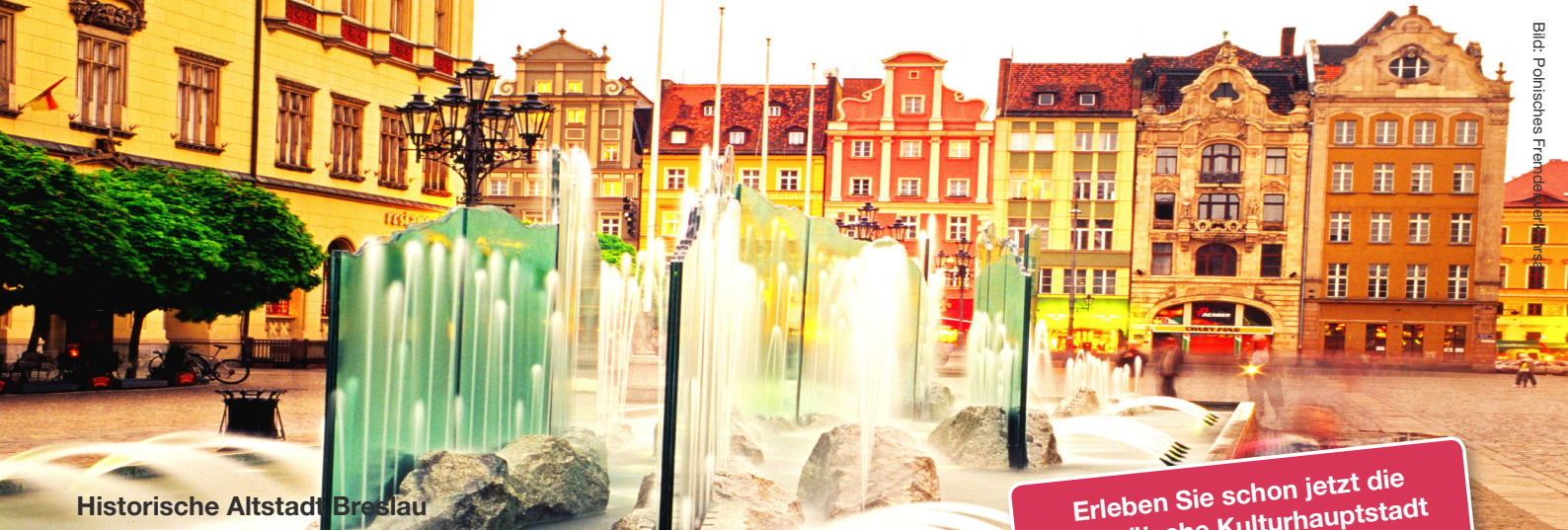
Historische Altstadt Breslau

Erleben Sie schon jetzt die europäische Kulturhauptstadt 2016!